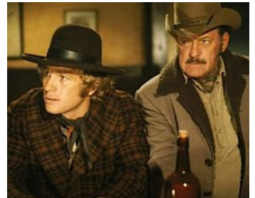
1971 DEUX HOMMES DANS L'OUEST (Wild Rovers) de Blake Edwards avec Ryan O'Neal