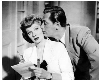
1949 MISS GRAIN DE SEL (Miss Grant takes Richmond) de Lloyd Bacon avec Lucille Ball