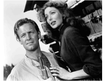
1948 LA FEMME VENDUE (Rachel and the Stranger) de Norman Foster avec Loretta Young