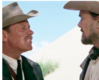
1969 LA HORDE SAUVAGE (The Wild Bunch) de Sam Peckinpah avec Ben Johnson