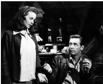
1948 L'AMOUR SOUS LES TOITS (Apartment for Peggy) de George Seaton avec Jeanne Crain