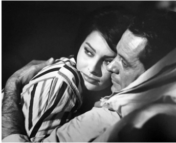
1958 LA CLÉ (The Key) de Carol Reed avec Sophia Loren