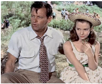
1955 PICNIC (Picnic) de Joshua Logan avec Susan Strasberg