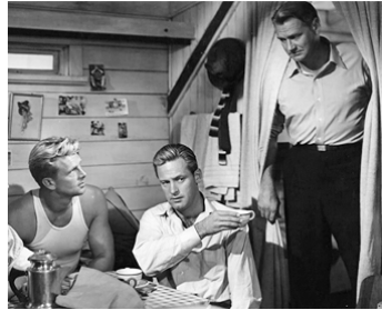
1947 ILS ÉTAIENT QUATRE FRÈRES (Blaze of Noon) de J. Farrow avec Sterling Hayden, Sonny Tufts