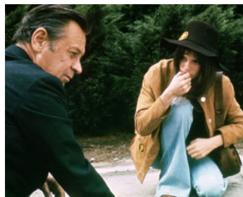
1973 BREEZY (Breezy) de Clint Eastwood avec Kay Lenz