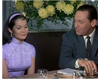
1960 LE MONDE DE SUZIE WONG (The World of Suzie Wong) de Richard Quine avec Nancy Kwan