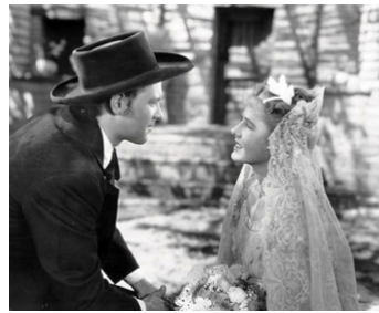
1940 ARIZONA (Arizona) de Wesley Ruggles avec Jean Arthur