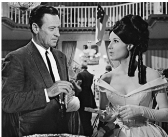
1966 ALVAREZ KELLY (Alvarez Kelly) d'Edward Dmytryk avec Janice Rule