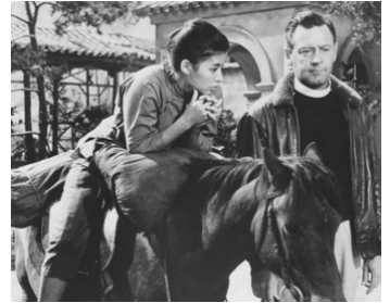
1960 HISTOIRE DE CHINE (Satan never sleeps) de Leo McCarey avec France Nuyen