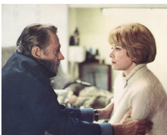
1977 DAMIEN, LA MALÉDICTION 2 (Omen II) de Don Taylor avec Lee Grant