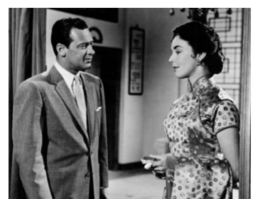
1955 LA COLLINE DE L'ADIEU (Love is a many-splendored thing) d'H. King avec Jennifer Jones