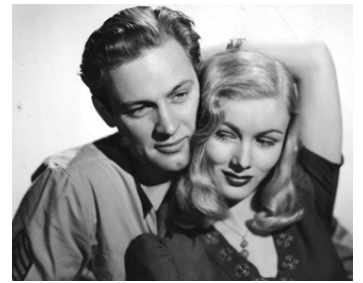
1940 L'ESCADRILLE DES JEUNES (I wanted Wings) de Mitchell Leisen avec Veronica Lake