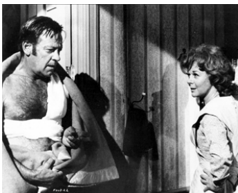
1972 LA POURSUITE SAUVAGE (The Revengers) de Daniel Mann avec Susan Hayward