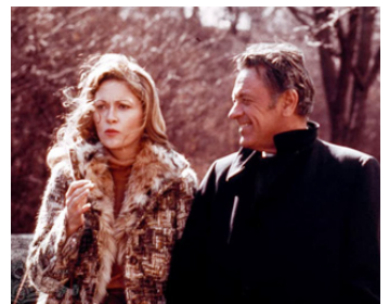
1976 MAIN BASSE SUR LA TV (Network) de Sidney Lumet avec Faye Dunaway