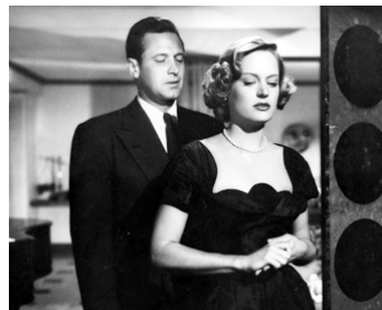
1952 LE CRAN D'ARRÊT (The turning Point) de William Dieterle avec Alexis Smith