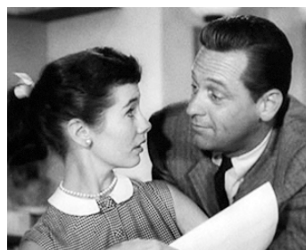
1953 LA LUNE ÉTAIT BLEUE (The Moon is blue) d'Otto Preminger avec Maggie McNamara