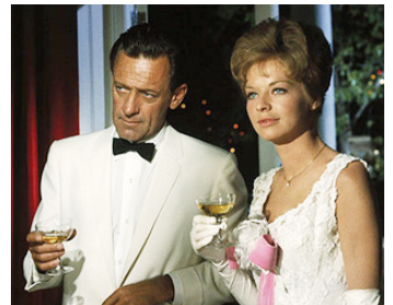
1964 LA SEPTIÈME AUBE (The seventh Dawn) de Lewis Gilbert avec Susannah York