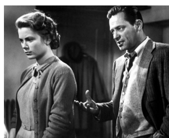
1954 UNE FILLE DE LA PROVINCE (The Country Girl) de George Seaton avec Grace Kelly