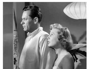
1954 LA TOUR DES AMBITIEUX (Executive Suite) de Robert Wise avec June Allyson