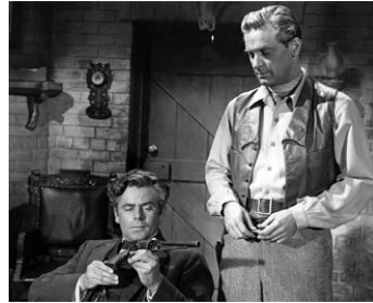
1948 LA PEINE DU TALION (The Man from Colorado) d'Henry Levin avec Glenn Ford