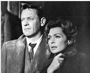
1961 TRAHISON SUR COMMANDE (The Counterfeit Traitor) de George Seaton avec Lilli Palmer