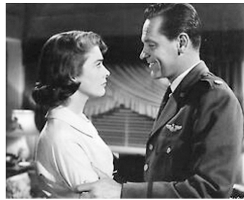
1956 JE REVIENS DE L'ENFER (Toward the unknown) de Mervyn LeRoy avec Virginia Leith