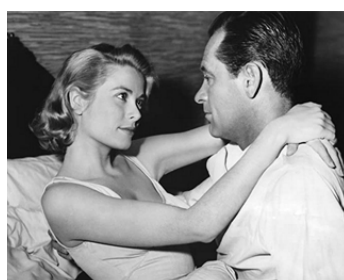
1954 LES PONTS DE TOKO-RI (The Bridges at Toko-Ri) de Mark Robson avec Grace Kelly