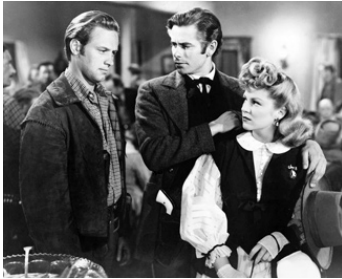
1941 TEXAS (Texas) de George Marshall avec Glenn Ford, Claire Trevor