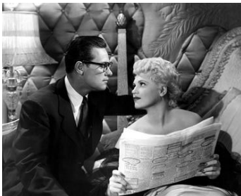
1951 COMMENT L'ESPRIT VIENT AUX FEMMES (Born Yesterday) de G. Cukor avec Judy Holliday