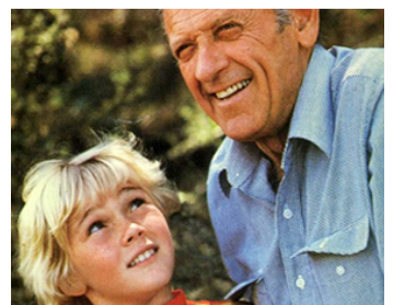
1980 AUSTRALIA KID (The Earthling) de Peter Collinson avec Ricky Schroeder