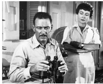
1955 UN MAGNIFIQUE SALAUD (The Proud and Profane) de George Seaton avec Thelma Ritter