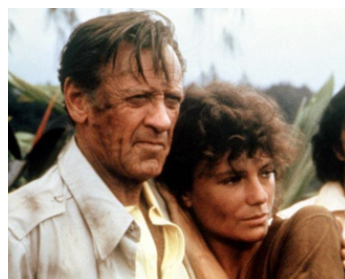
1979 LE JOUR DE LA FIN DU MONDE (When time ran out) de J. Goldstone avec J. Bisset