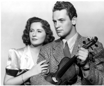
1938 L'ESCALE AUX MAINS D'OR (Golden Boy) de Rouben Mamoulian avec Barbara Stanwyck