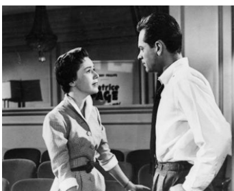
1953 L'ÉTERNEL FÉMININ (Forever female) d'Irving Rapper avec Pat Crowley