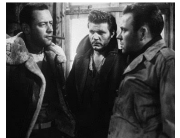
1952 STALAG 17 (Stalag 17) de Billy Wilder avec Neville Brand, Richard Erdman