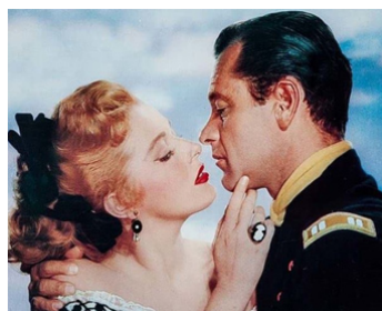
1953 FORT BRAVO (Escape from Fort Bravo) de John Sturges avec Eleanor Parker