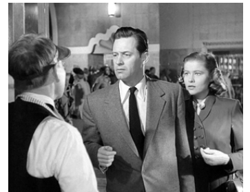
1950 MIDI GARE CENTRALE (Union Station) de Rudolph Maté avec Nancy Olson