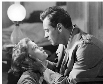
1951 LES AMANTS DE L'ENFER (A Guy for Joe) de Michael Curtiz avec Nancy Olson