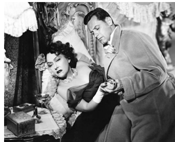
1950 BOULEVARD DU CRÉPUSCULE (Sunset Boulevard) de Billy Wilder avec Gloria Swanson