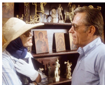
1978 FEDORA (Fedora) de Billy Wilder avec Marthe Keller