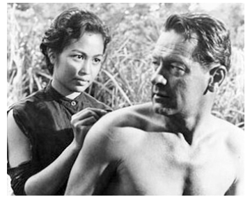
1957 LE PONT DE LA RIVIÈRE KWAÏ (Bridges of the River Kwai) de D. Lean avec Ngamta Suphaphongs