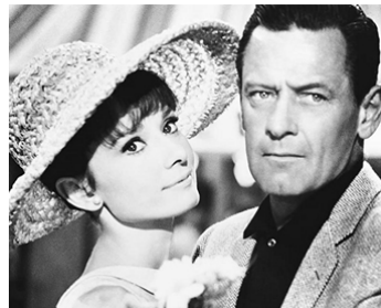
1963 DEUX TÊTES FOLLES (Paris when it sizzles) de Richard Quine avec Audrey Hepburn