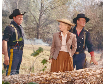
1959 LES CAVALIERS (The Horse Soldiers) de John Ford avec Constance Towers, John Wayne