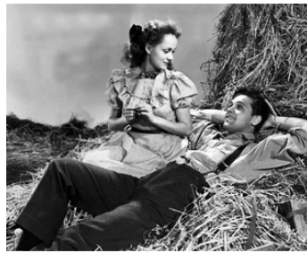
1940 UNE PETITE VILLE SANS HISTOIRE (Our Town) de Sam Wood avec Martha Scott